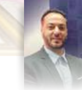
إعداد الفنان : محمد الشنطي Mohammad Shanti

بتنظيم من سفير الهند في رام الله سونيل كومار